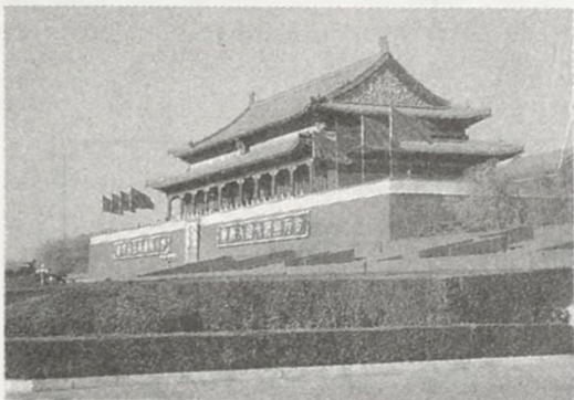
天 安 门

五年(1417年),原名承天门,清顺治八年(1651年)改建后称天安门。城门5阙,重楼9楹,通高34.7米。在2000余平方米雕刻精美的汉白玉须弥基座上,是高10余米的红色墩台,正中悬挂着毛泽东巨幅画像,两边分别镶嵌着“中华人民共和国万岁”、“全世界人民大团结万岁”的大幅标语。墩台上是金碧辉煌的天安门城楼,城楼重檐飞翘,雕梁画栋,黄瓦红墙,异常壮丽。城楼下是碧波粼粼的金水河,河上有5座雕琢精美的汉白玉金水桥。城楼前两对雄健的石狮和挺秀的华表巧妙地相配合,使天安门成为一座完整的建筑艺术杰作。天安门是新中国的象征。庄严肃穆的天安门图形是我国国徽的组成部分。1988年起,天安门城楼向游人开放。为全国重点文物保