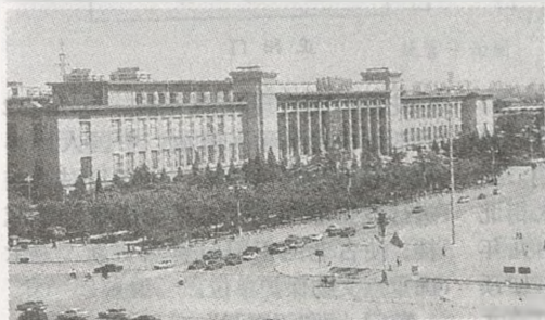
中国革命博物馆与中国历史博物馆

毛主席纪念堂 在天安门广场南端。1976 年 11 月 24 日奠基,1977 年 9 月 9 日落成。纪念堂大门正上方镶嵌着“毛主席纪念堂”汉白玉金字匾。枣红色花岗石砌成的高大基座上,屹立着 44 根花岗石廊柱,高高擎起金色琉璃重檐屋顶,是一座具有我国民族风格的正方形宏伟建筑物。纪念堂由北大厅、瞻仰厅、南大厅组成。北大厅是在瞻仰毛泽东遗容前举行悼念活动的场所,大厅中央是 3 米多高用汉白玉雕成的毛泽东坐像,坐像背后墙上悬挂